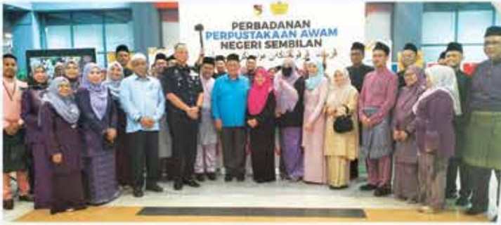
15 MEI 2023 MAJLIS JALINAN MESRA AIDILFITRI PERBADANAN PERPUSTAKAAN AWAM NEGERI SEMBILAN DI PERPUSTAKAAN NEGERI, SEREMBAN 2