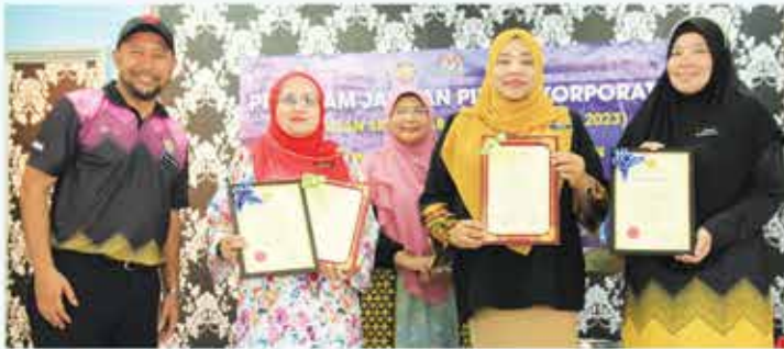
26 JUN 2023 PROGRAM JALINAN KORPORAT (JKP) THE GREAT PSS AND MUSSOLA DI SEKOLAH KEBANGSAAN SENAWANG, SEREMBAN