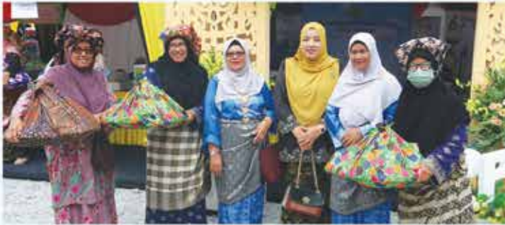
9 JUN 2023 MAJLIS PERASMIAN PERPATIH FEST DI MUZIUM NEGERI SEMBILAN, SEREMBAN