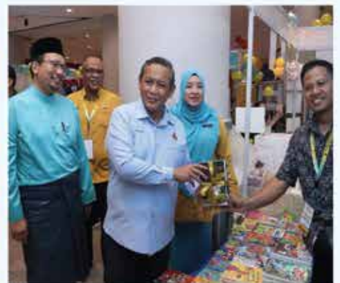
MAJLIS PERASMIAN PESTA BUKU NEGERI SEMBILAN 2023