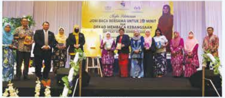
18 MEI 2023 MAJLIS PELANCARAN JOM BACA BERSAMA 10 MINIT DAN DEKAD MEMBACA KEBANGSAAN DI CASA LEGENDA CONVENTION CENTRE SENAWANG, SEREMBAN