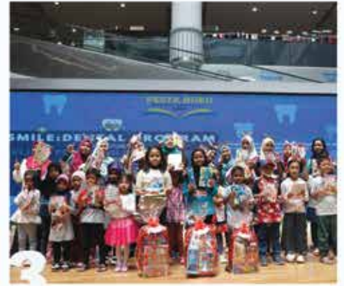
SMILE : DENTAL PROGRAMME