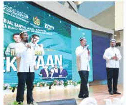
BUAL SANTAI ASAL SAMPAI: ILMU JALAN KEKAYAAN