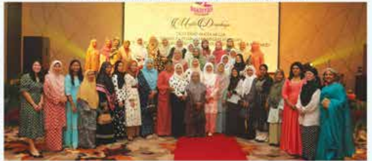
27 JUN 2023 MAJLIS DIRGAHAYU DYMM TUNKU AMPUAN BESAR NEGERI SEMBILAN DI HIBISCUS GRAND BALLROOM, LEXIS HIBISCUS PORT DICKSON