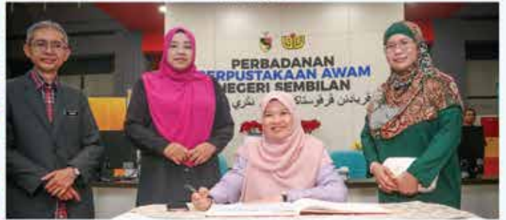
14 JUN 2023 FESTIVAL BAHASA DAN SASTERA PERINGKAT NEGERI SEMBILAN ANJURAN DEWAN BAHASA DAN PUSTAKA (DBP) DENGAN KERJASAMA PERBADANAN PERPUSTAKAAN AWAM NEGERI SEMBILAN (PPANS)