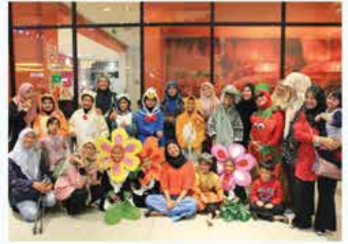
TEATER KANAK-KANAK OLEH SEKOLAH KEBANGSAAN TAMAN TASIK JAYA, SENAWANG