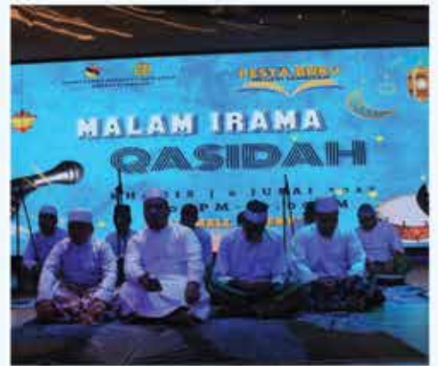
MALAM IRAMA QASIDAH