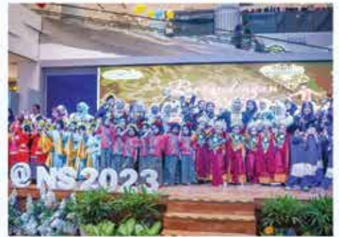
PERTANDINGAN TARIAN RAMPAIAN TRADISIONAL