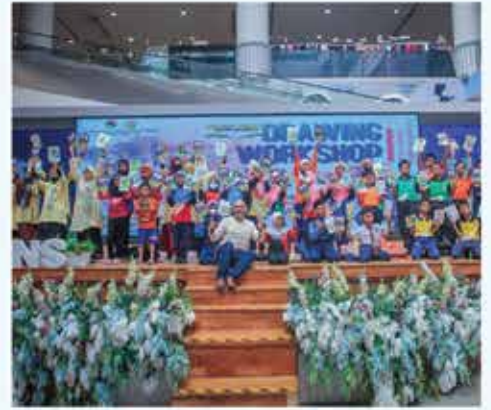
DRAWING WORKSHOP BERSAMA UNEH RAJA PENSIL WARNA MALAYSIA