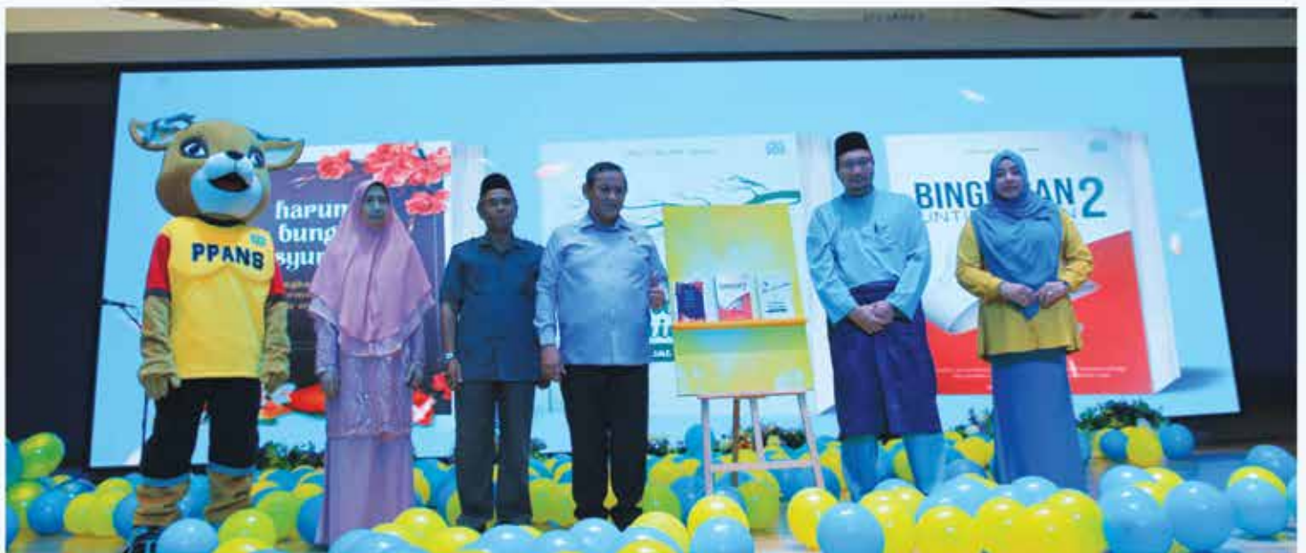
5 JULAI 2023 MAJLIS PERASMIAN PESTA BUKU NEGERI SEMBILAN 2023 DI MYDIN MALL, SEREMBAN 2