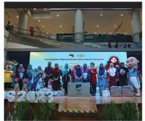
PENAMPILAN ISTIMEWA BERSAMA UPIN DAN IPIN DAN CABUTAN BERTUAH PESTA BUKU NEGERI SEMBILAN 2023