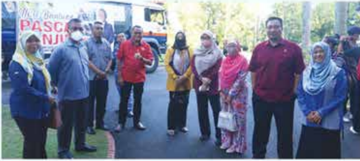
9 JANUARI 2023 MISI BANTUAN PASCA BANJIR KERAJAAN NEGERI SEMBILAN KE PANTAI TIMUR DI KEDIAMAN RASMI MENTERI BESAR NEGERI SEMBILAN