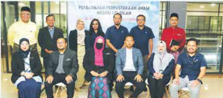
3 FEBRUARI 2023 KUNJUNGAN HORMAT PENGARAH SURUHANJAYA KOMUNIKASI DAN MULTIMEDIA (SKMM) DI PERPUSTAKAAN NEGERI, SEREMBAN 2