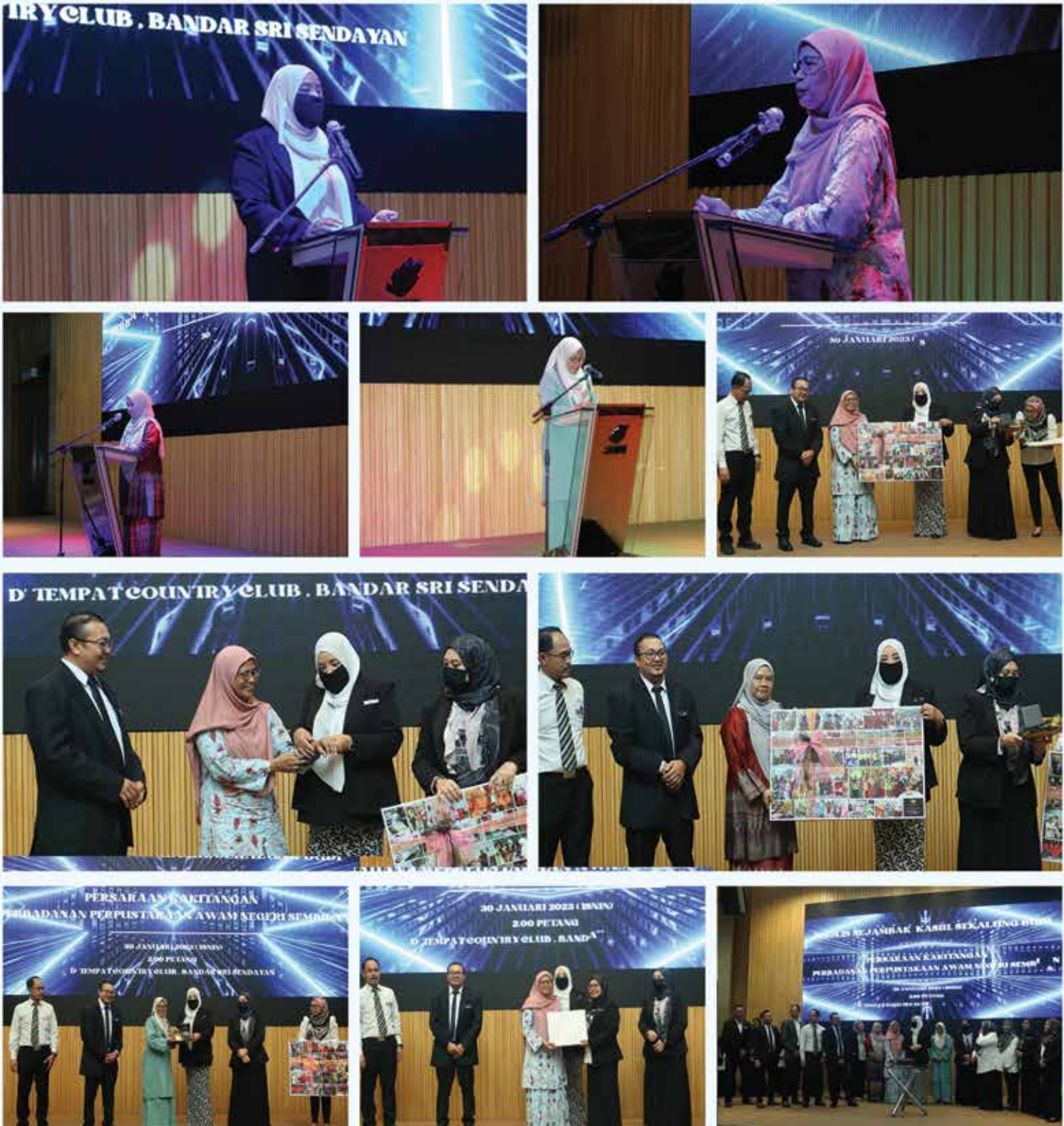
PERBADANAN PERPUSTAKAAN AWAM NEGERI SEMBILAN