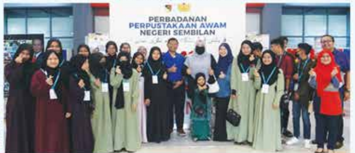
1 APRIL 2023 PROGRAM SUMBANGAN BANTUAN OLEH SWM ENVIRONMENT SDN BHD DAN PPANS