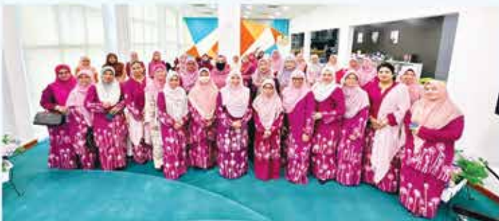
20 FEBRUARI 2023 PROGRAM RAMAH MESRA BERSAMA BAKRIYAH NEGERI SEMBILAN DI PERPUSTAKAAN NEGERI, SEREMBAN 2