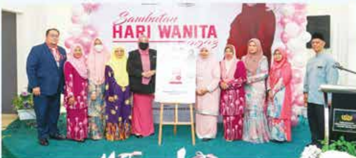
7 MAC 2023 SAMBUTAN HARI WANITA 2023 DI PERPUSTAKAAN NEGERI, SEREMBAN 2