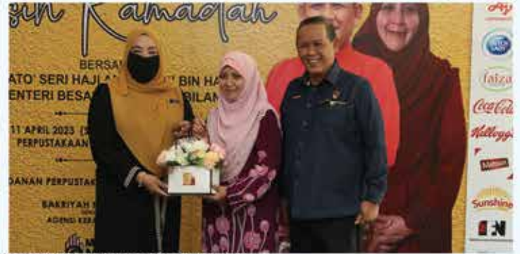
PERBADANAN PERPUSTAKAAN AWAM NEGERI SEMBILAN