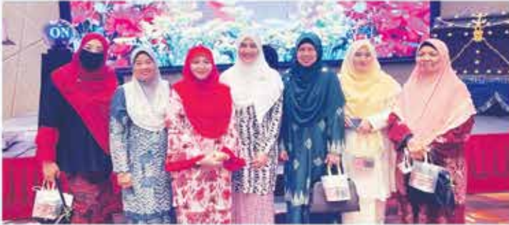
19 JANUARI 2023 MAJLIS PELANCARAN BULETIN PERKEP IPD PORT DICKSON DI GRAND BALLROMM LEXIS HIBISCUS, PORT DICKSON