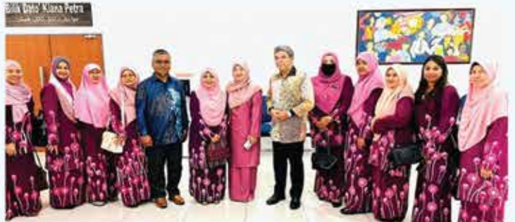
11 FEBRUARI 2023 FESTIVAL BAKAT PRA-SEKOLAH PERINGKAT NEGERI SEMBILAN TAHUN 2023 DI WISMA BANDARAYA SEREMBAN (MBS)