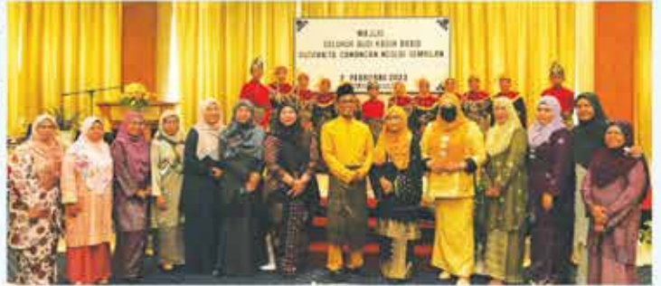
2 FEBRUARI 2023 MAJLIS SELUHUR BUDI KASIH ABADI PUSPANITA CAWANGAN NEGERI SEMBILAN DI KLANA RESORT, SEREMBAN