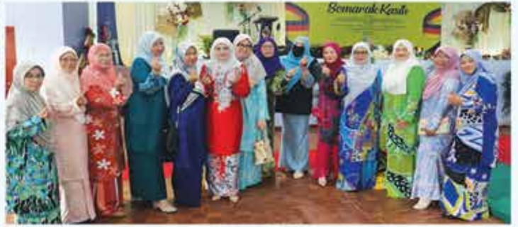
15 JANUARI 2023 SEMARAK KASIH BERSAMA DYMM TUNKU AMPUAN BESAR NEGERI SEMBILAN DARUL KHUSUS DI DEWAN TUNKU AMPUAN NAJIHAH SRI MENANTI