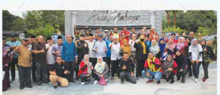
30 FEBRUARI 2023 PROGRAM KAJIAN DAN KEILMUAN JELAJAH SERTA ZIARAH PUSAKA LUAK BERADAT LUAK TERACHI BERSAMA KETUA JABATAN NEGERI SEMBILAN DI TERACHI, KUALA PILAH